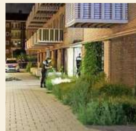
De politie zoekt naar aanwijzingen.

Met de opening van het Jakoba Mulder Huis verlaat de Hogeschool van Amsterdam de Leeuwenburg, het betonnen blokkengebouw dat naast het Amstelstation staat. Daar heeft de school 24 jaar lang gezeten. De Leeuwenburg wordt de komende jaren vernieuwd.